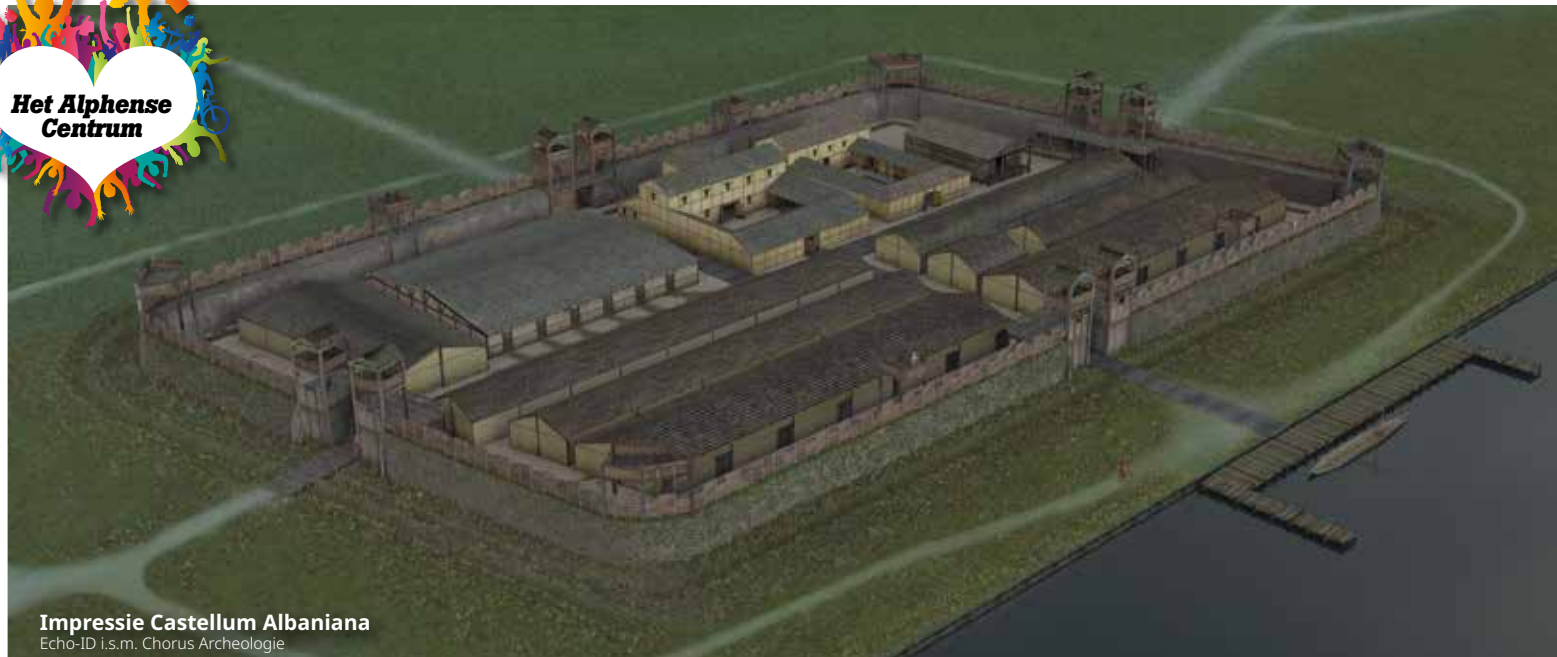
Impressie Castellum Albaniana Echo-ID i.s.m. Chorus Archeologie