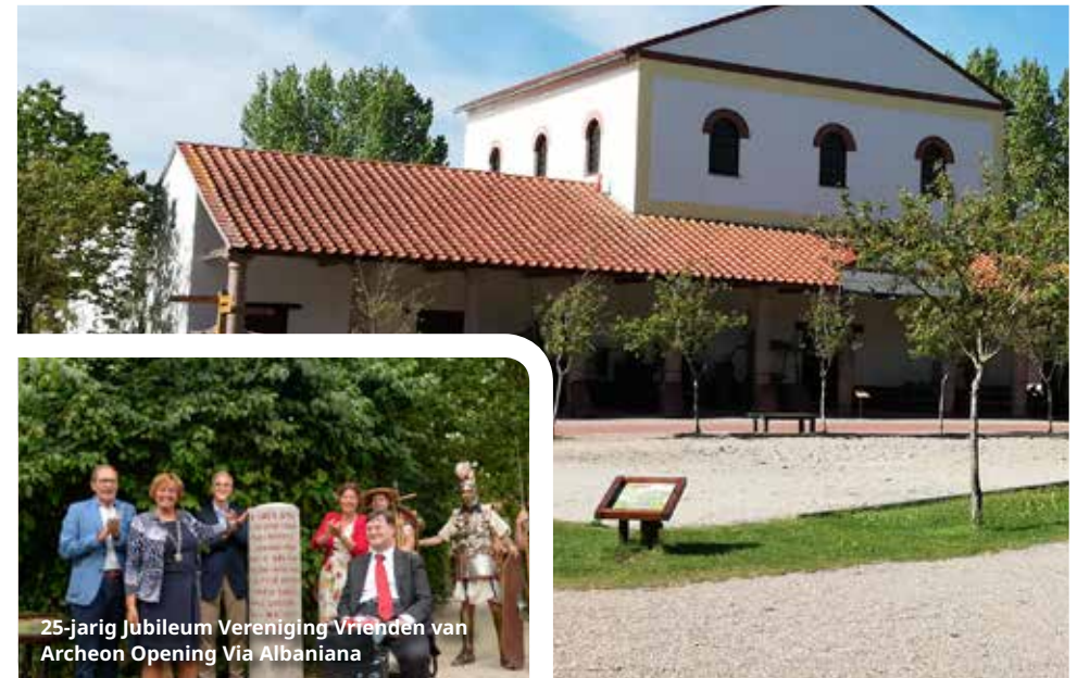
25-jarig Jubileum Vereniging Vrienden van Archeon Opening Via Albaniana