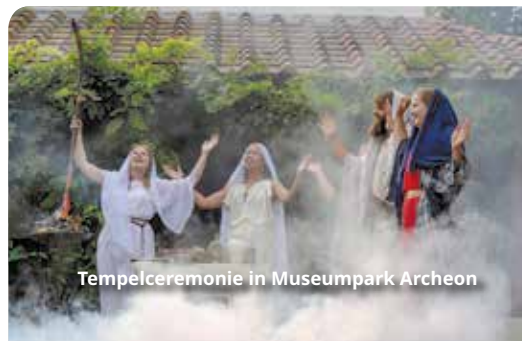
Tempelceremonie in Museumpark Archeon