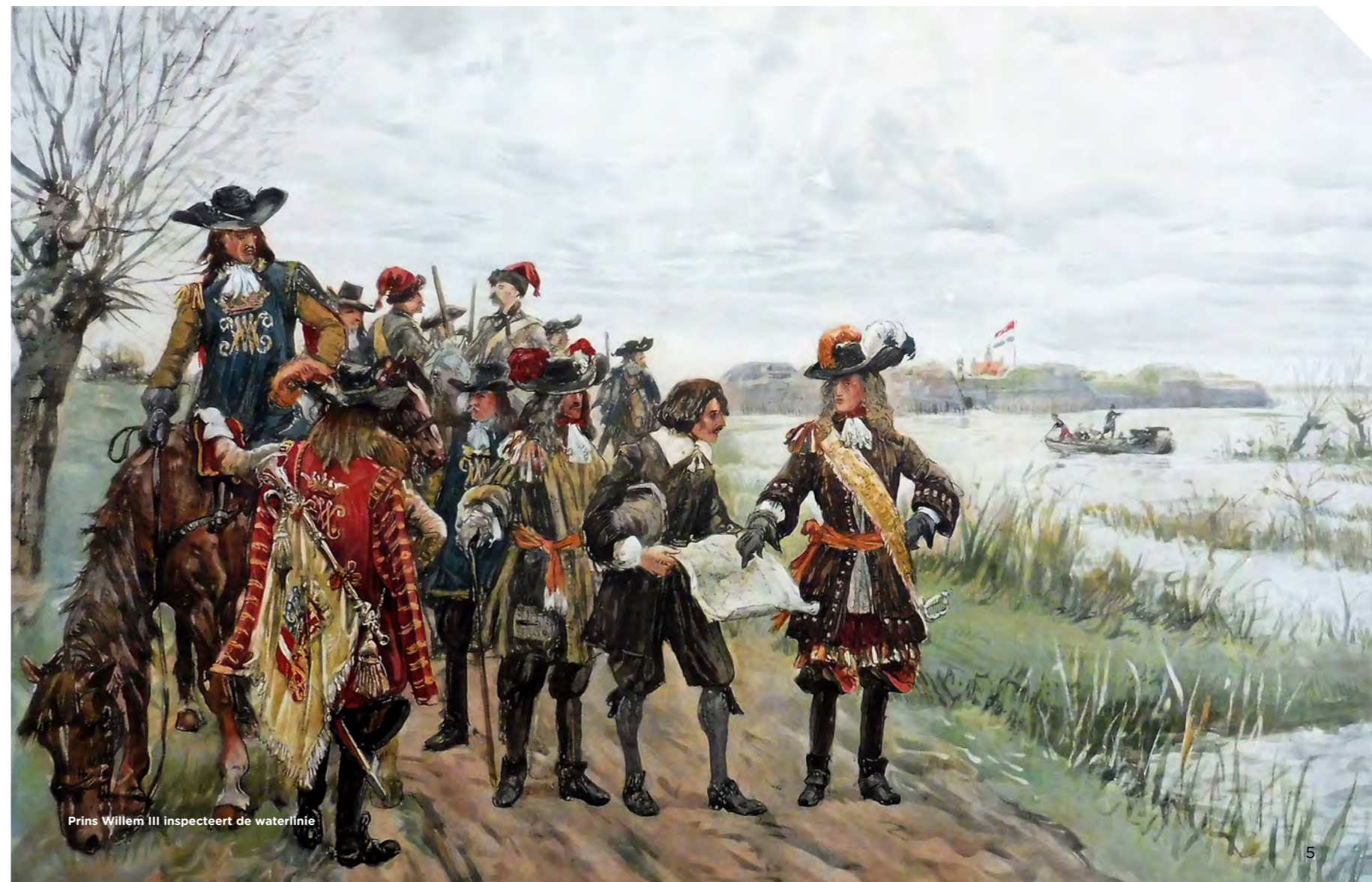
Prins Willem III inspecteert de waterlinie

Na het vertrek van de Fransen eind 1673 werd nog tientallen jaren gewerkt aan het versterken van vestingsteden en forten. Steden als Naarden, Weesp, Woerden en Nieuwpoort danken hun vorm aan deze bouwperiode. Ook het Fort Wierickerschans aan de Oude Rijn werd in 1673 gebouwd. In de achttiende eeuw werd meerdere keren geprobeerd om de Oude Hollandse Waterlinie opnieuw in gebruik te nemen. In 1748 bleef het bij proefoverstromingen, in 1787 mislukte